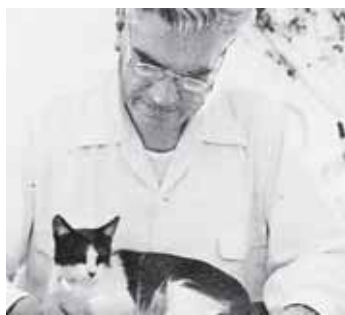
► El archivo Manuel Rojas está en la UC.

con su madre desde Francia. Pero buena porción de los originales de madurez del poeta del creacionismo no están en el país.