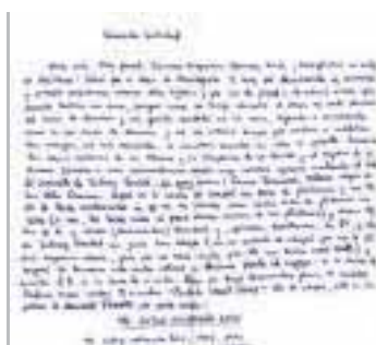
► La UDP adquirió cartas de Bolaño.